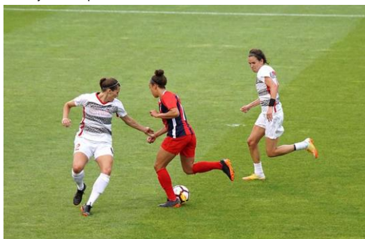
d. Jeffrey Lin/Unsplash